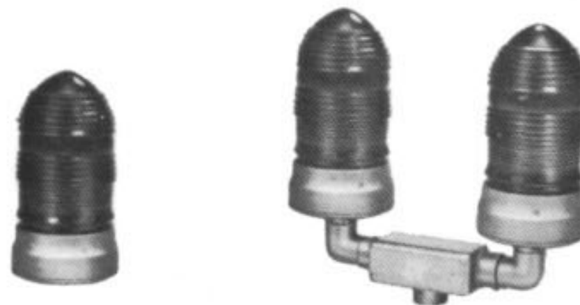
CX/ZS80 e CX/ZS82

Aparelho sinalizador para uma ou duas lâmpadas incandescentes de 60w. Corpo em liga de alumínio fundido, globo pigmentado na cor vermelho ou outras cores a pedido.