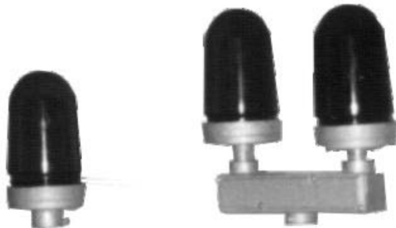
CX/ZS81 e CX/ZS83

Dimensões: CX/ZH2000 - 500 x 200 x 445 mm.