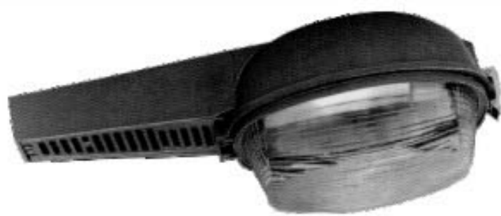
CX/X19-3 e X19-5

Luminária fechada, corpo, aro e alojamento em liga de alumínio fundido, refletor em chapa de alumínio anodizado, refrator prismático em vidro boro silicato a pedido em policarbonato, soquete E-40.